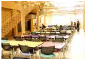
薬学部スタジオプラザ【1階】