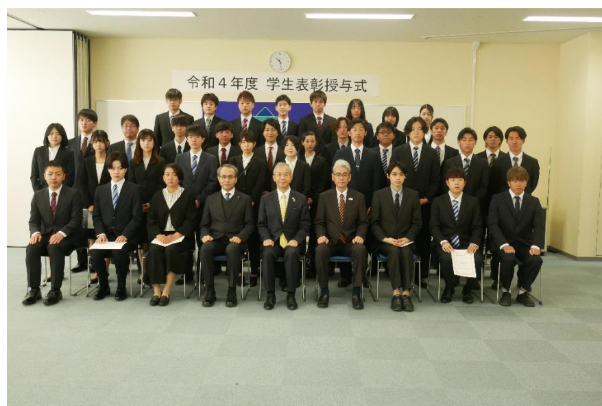
2022年度学生表彰授与式を開催しました