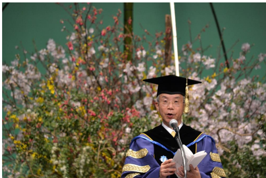
令和4年度卒業式・修了式を挙行了しました