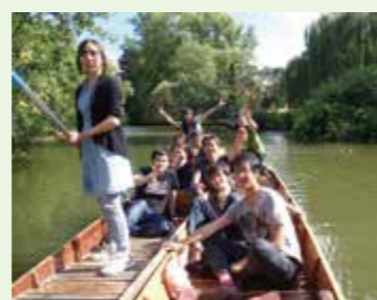
研究室のメンバーと共にCherwell川でボウイングしている様子