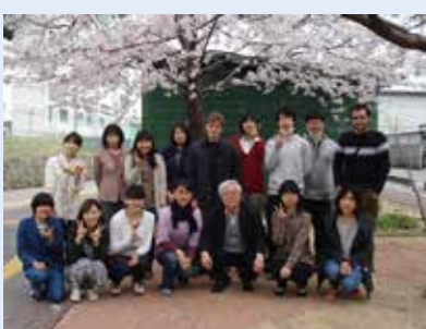
研究室のメンバーとお花見

感をかけてしまうのですが、もっと日本語を上達させ、周りの人に対する気配りを学んで、より円滑な人間関係が築けるようになっていきたいと思っています。将来の進路についてはまだはっきりわかりませんが、後から振り返って後悔のないように、自分らしく生きていきたいと思っています。まだ若いうちに自分に限界を作ることなくたくさん経験を積んで、研究や学業はもちろん、日本の文化を学んだりいろいろな人と交流をしたり旅行をしたりして、徳島での生活を楽しみたいと考えています。