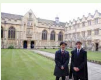
研究室の友人とUniversity collegeにて