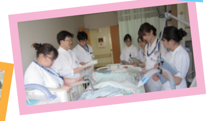
ニュートリション・サポート・チーム（NST）・病院内実習 栄養指導・回診風景など 撮影場所：徳島大学病院にて